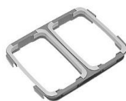
Divisória do coletor