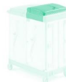
Bandeja central com