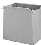
Sem tampa na capa