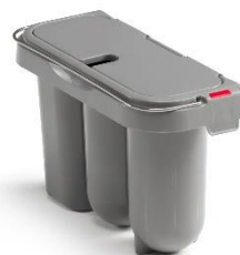
Compartimento para escova