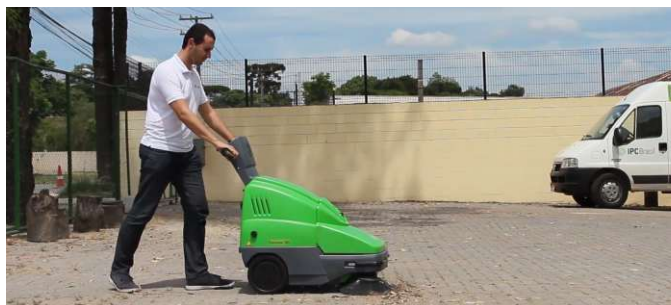
Total visibilidade da escova lateral durante o trabalho