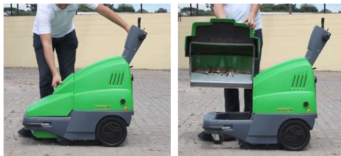
Caçamba construída com materiais leves facilitam a descarga dos resíduos.