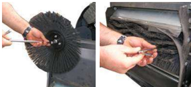
Um parafuso para remover a escova lateral