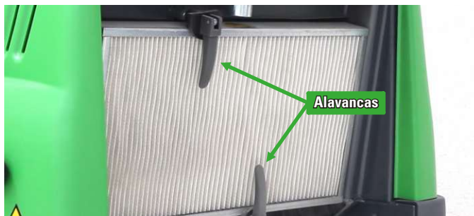
Filtro facilmente removível através de duas alavancas