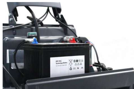
Bateria, ajuste de pressão da escova central, motor de aspiração e motores das escovas e de tração